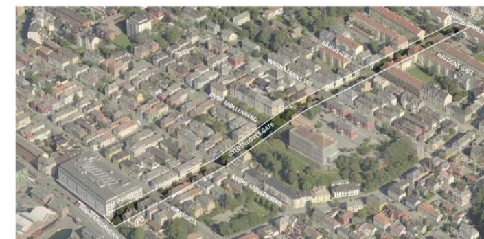
Gyldenløves gate strekker seg mellom Rosenborg (Stadsing, Dahls gate) og Solsiden (Innherredsveien).

Det planlegges utvidelser av fortau og etablering av soner for beplantning og opphold. I enkelte kvartal kan dette gå på bekostning av gateparkering og antall kjørefelt for bil. Planen skal sikre trygge og trafikksikre løsninger for alle brukergrupper.