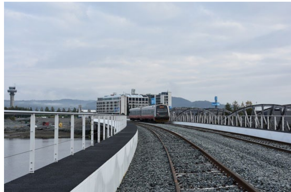
Dobbeltspor på Stjørdalselva bru