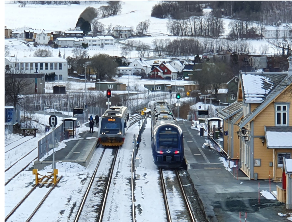
Gammelt og nytt på Ranheim stasjon