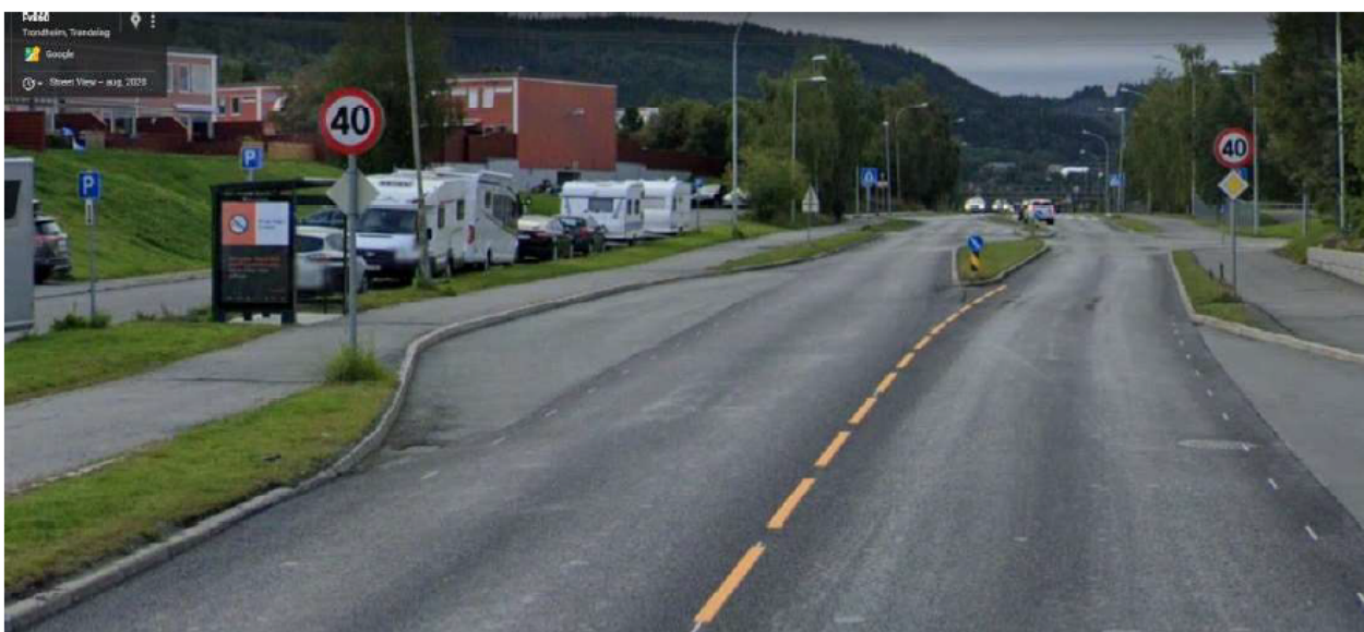
Figur 9: Busstoppe Venusvegen sett sørover på venstre side ligger tett på Utleirtunet.

Det er likevel store problemer knyttet til dette temaet for denne delen av Utleirvegen. I planinitiativet bør forskjellen mellom grenseverdier i T-1442 (rød og gul sone) og prosjektets (Miljøpakkens) grenseverdi kommenteres. Saksutredningen bør kommentere/beskrive kort Miljøpakkens støyskjermingsprosjekter på vestsiden av Utleirvegen. Dette for å svare ut tidligere innbyggerforslag vedr. problemer med støy langs Utleirvegen, og på hvilken måte dette prosjektet kan være en del av løsningen.