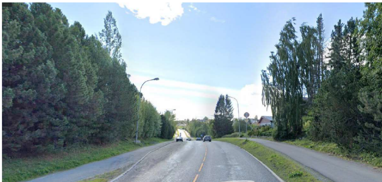
Figur 5: På begge sider av vegen står det mange større trær.

Dette er en hovedveg med klare og gode grønne kvaliteter som det er viktig at ikke svekkes. Vegetasjon og trær langs strekningen bør kartlegges for å vise hva som blir berørt. Sjekk kommunens naturtypekart, nasjonale databaser samt supplere der info mangler eller er utdatert. Man må kartlegge fremmede planter og utarbeide tiltaksplan hvis funn av uønska arter. Begge kartleggingsjobbene må gjøres i vekstsesongen. Man bør beskrive vektning av fordeler og ulemper ved eventuelt smalere trafikkareal istedenfor økt bredde for sykkelveg med fortau der det kan være større trær eller svært verdifulle trær som blir berørt. Valg av løsning som går ut over grønne verdier må grunngis. Ideelt sett burde man utnytte bredder der det er mulig for å opprettholde eller etablere grøntrabatter med vegetasjon, f.eks. oppstammede trær som ikke hindrer friskt.