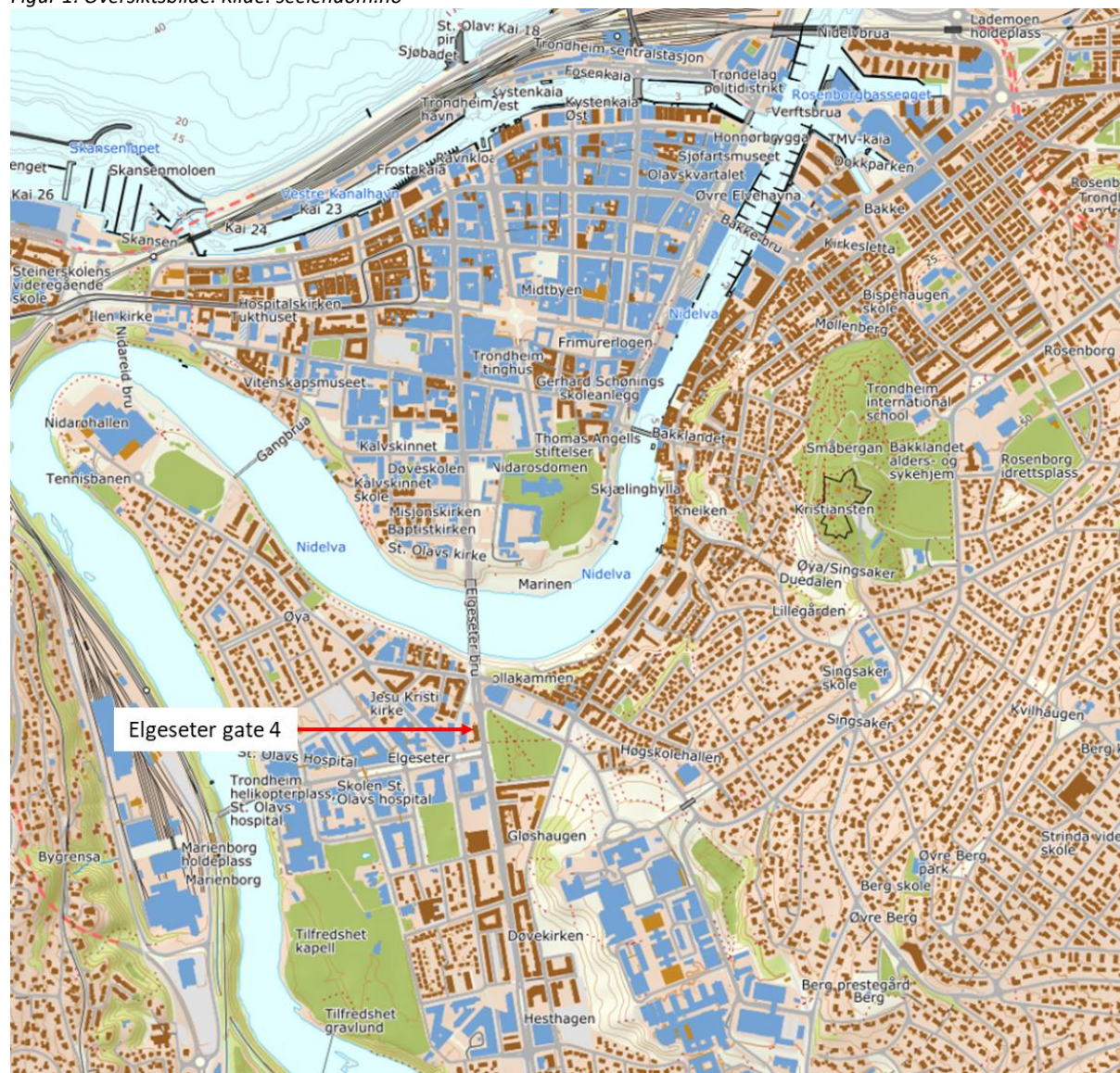
Figur 1: Oversiktsbilde.

Eiendommens bygningsmasse har fasade mot Elgeseter gate. Kollektivknutepunkt ved Studentersamfundet ligger like ved. Det er gangavstand fra eiendommen til alt av dagligvare, midtbyen, sykehus, universitet, m.m.