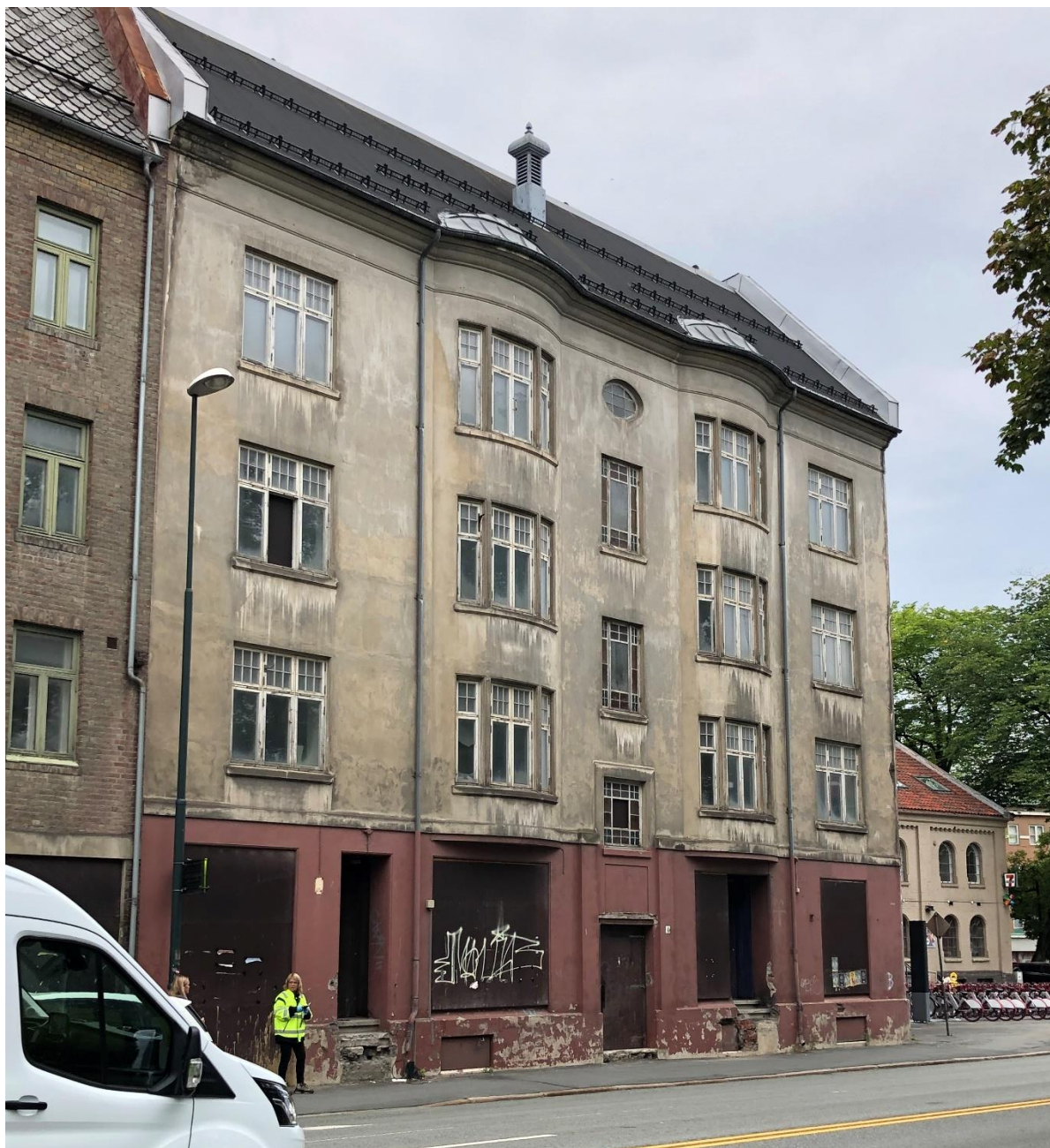
Figur 2: Elgeseter gate 4. Kilde:

På eiendommen står det oppført et murbygg i jugendstil, oppført i 1911, over fire etasjer pluss kjeller og loft. Gården inneholdt opprinnelig syv romslige leiligheter med egne bad/toalett, hvorav én leilighet i 1. etasje sammen med forretningslokaler. Av hensyn til plassering og støy forutsetter vi at hele 1 etasje settes av til næringsvirksomhet. Videre har vi basert på oppmålinger i oversendte plantegninger estimert bygningsmassens totalareal til ca. 1.265 m 2 . Arealet fordeler seg som vist i tabell 1 under.